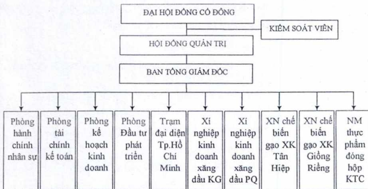
Cơ cấu tổ chức Công ty Cổ phần Thương mại Kiên Giang

Sau cổ phần hóa, Công ty thay đổi mô hình hoạt động phù hợp với loại hình công ty cổ phần. Sơ đồ tổ chức bộ máy hoạt động của các phòng ban và các bộ phận chức năng không có sự thay đổi so với trước cổ phần hóa.